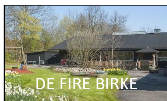
DE FIRE BIRKE